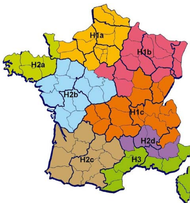
Carte des zones climatiques définies par la réglementation thermique

Enfin, au regard de leurs consommations énergétiques évaluées dans le cadre de la réglementation thermique, les ventilations double flux sont essentiellement préconisées en zones climatiques de type H1, les plus exposées au froid.